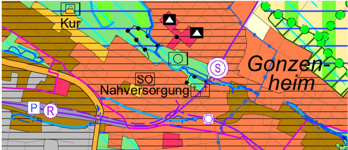
Auszug aus dem Flächennutzungsplan 2010