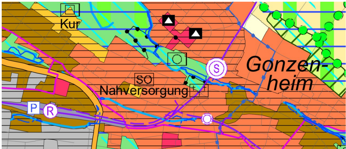
Auszug aus dem Flächennutzungsplan 2010